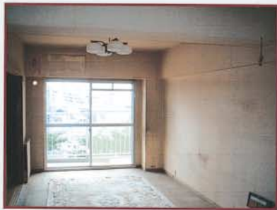
▲No1 柱・梁の出たマンション固有のインテリア