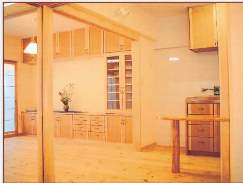
▲No3 床・壁・天井・建具・家具まで自然素材で統一