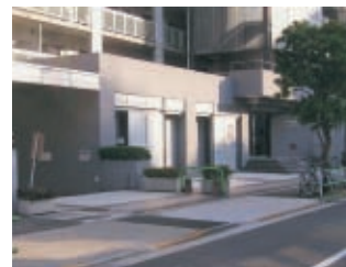
外観ファサード・リフォーム前