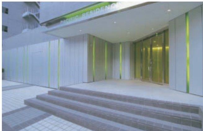
外観ファサード・リフォーム後