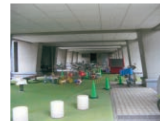
ピロティ・リフォーム前