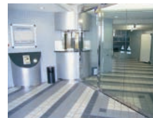
エントランスホール・リフォーム前