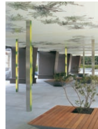
ピロティ・リフォーム後(昼間)

※内照式のスリット・ポールは感知式によって適時に照明が付き、夜間は午前零時で自動消灯する。光源は、全て長寿命のインバーター蛍光灯を使用している。