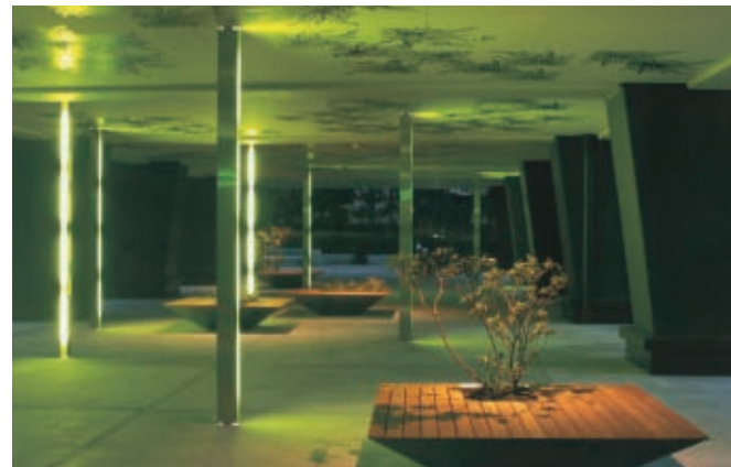
ピロティ・リフォーム後(夜間)