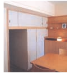
③子供スペースへの潜り