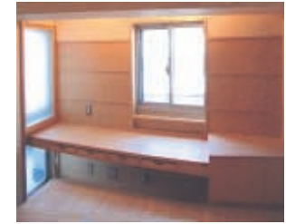
⑨寝台窓際のデスク