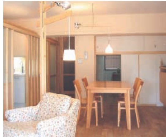
②ダイニング奥に子供スペースへの潜り。潜りの上部ベッド、脇の収納は家具工事で作造。直天井にしたため、壁と床からの配線に対応した照明にデザイン。