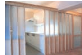
⑩洗面まで連続するスクリーン