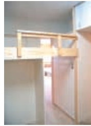
④ベッド監建具も開放し通風