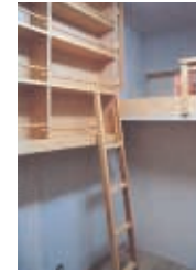
⑧子供用書棚とベッド