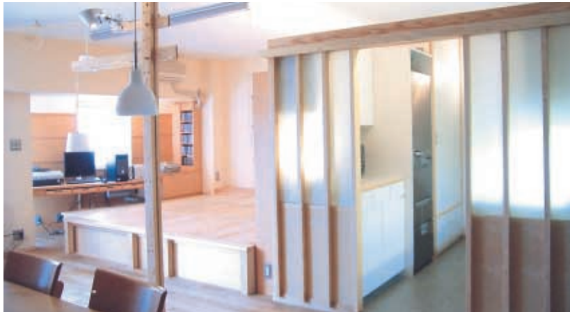
①リビング・ダイニングから見ると大きな照明のように光る“明かりスクリーン” 左は収納を兼ねた寝台とその窓際にデスク