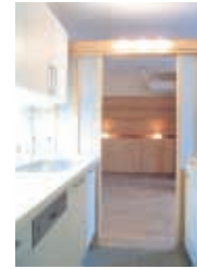
⑥キッチンの内法上部は開放