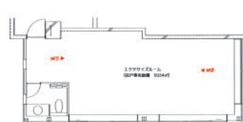
改修前 平面図 1/150