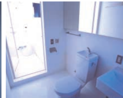
③白で統一された清潔感のある洗面脱衣室