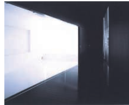
④黒の部屋から白の部屋を見通す