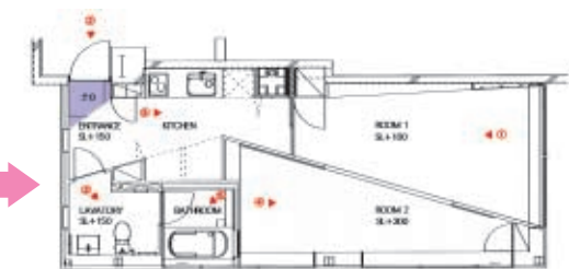
改修後 平面図 1/150