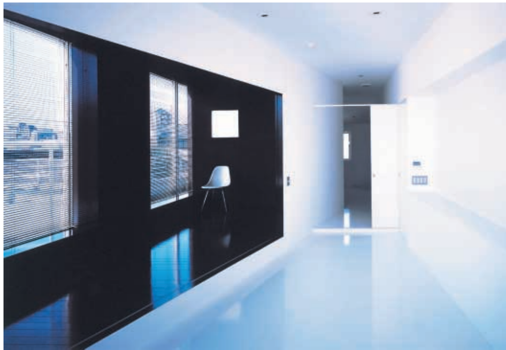
①白の部屋からエントランス方向を見通す

集合住宅内のエクササイズルームを賃貸住戸に転用。既存の大きな窓と眺望をもとに斜めに分割された二つの空間は、床段差と大胆な色分けによるコントラストが強烈。都心の賃貸では、このような非日常的空間も許されるだろう。