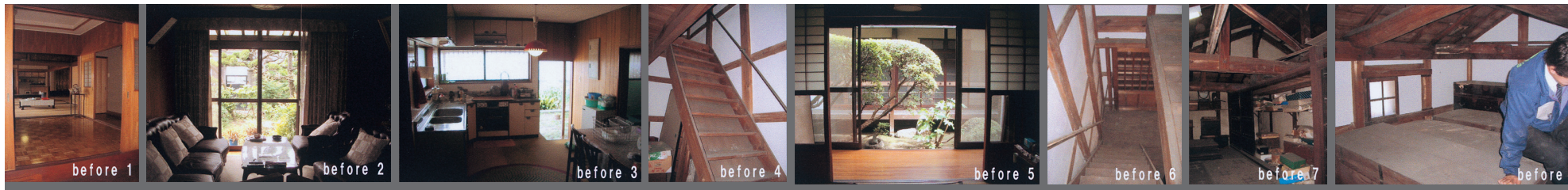
リフォーム前後の写真

分節や凹凸に富む古民家の、大空間の良さを活かしながら、新しい素材を適所に使いこなし、すっきりとした抜けのあるモダンな雰囲気を作り上げている。照明や採光等にも気配りのゆきとどいた秀作である。ただ、図面が判りにくい。