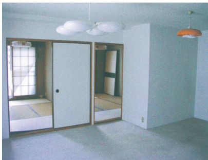
リフォーム前 LDKから個室を見る