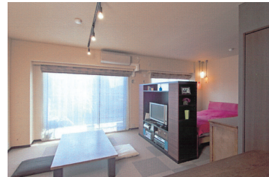
リビングは、TVボードを兼ねた3方向から使える収納で、ベッドコーナーと分けた。