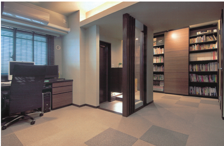
北側2室と玄関まで一体化して広さと明るさを確保したオフィススペース。入り口正面には、アクリル板とスリットを組み合わせたデザイン壁を設けた。