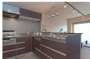
キッチンは対面式のオープンスタイルとし、開放感を出した。