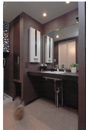
洗面所にはペットのトイレスペースを設けた。