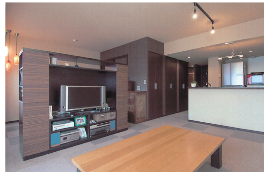
リビング側は、ワンルムのLDK+ベッドコーナー。オフィス関係のものがなくなり、くつろげる空間になった。