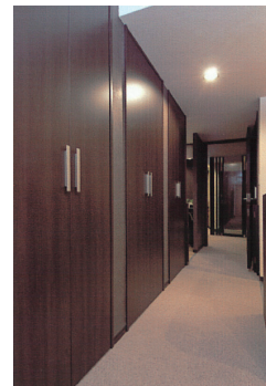
リビング側からオフィス側への通路には壁面収納をたっぷり取った。