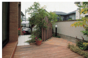
G 外部は植栽とデッキで演出した