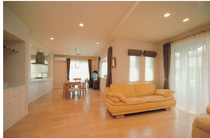
A 東南面にLDKを広げ、日当たりと風通しを良くした