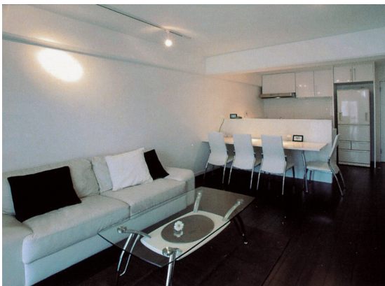
A ホワイトとダークブラウンでシャープな雰囲気にとまとめた