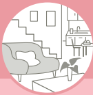
リフォーム前後の写真