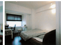
F,G,H 個室は全てに窓が取れるように配置した