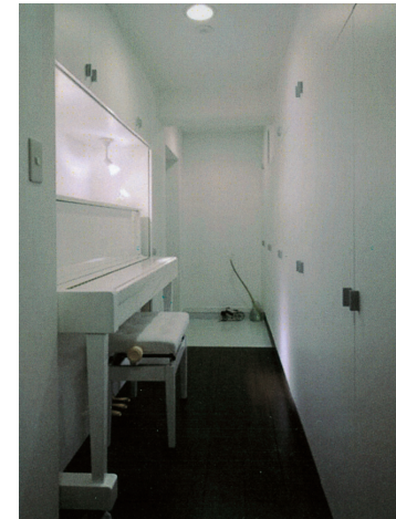
C 廊下の一面を収納とし、ピアノも設置できるようにした