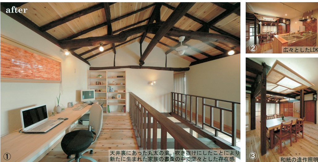
天井裏にあった丸太の梁。吹き抜けにしたことにより新たに生まれた家族の書斎の中で堂々とした存在感