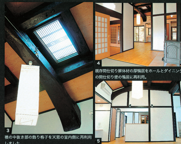
3 襖の中抜き部の飾り格子を天窓の室内側に再利用しました。