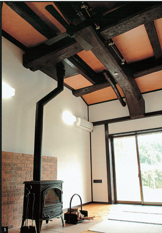
1 ストープ上部へ伸びる煙突材からの発熱もあり、ストープだけでLDK全体が暖かく、夜、就寝前に火種ほどの状態でも朝まで室温を保つことができます。