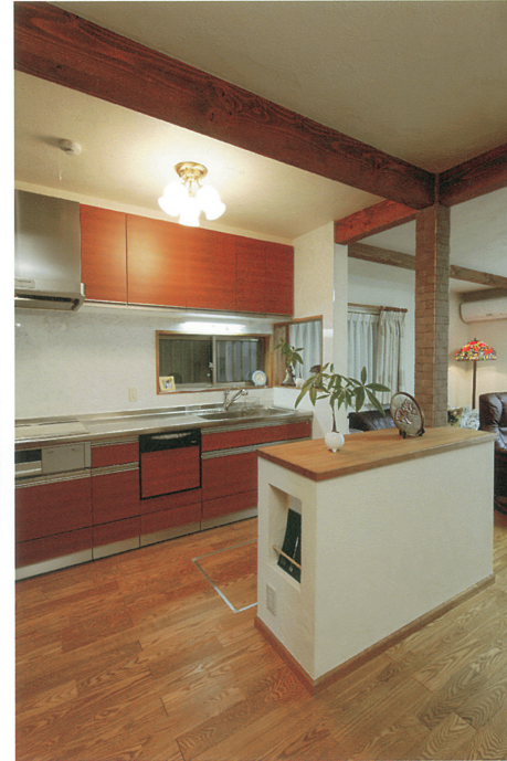
③ 抜けない柱を利用して作業台を造作。下にはゴミ箱等を収納出来る様にした。補強梁は見せて抜けない柱にはエコカラットを貼った。キッチンにはIHを入れた。