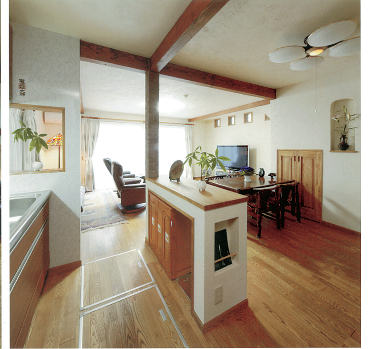
④ 将来は、ご夫婦の寝室としても利用できるように広々としたLDKにした。車椅子になった場合も想定し暮らしやすいようにした。壁天井は珪藻土で仕上げ、憧れだったリクライニングチェアも購入し、毎日映画鑑賞をご夫婦で楽しんでいる。

リフォームの動機／設計・施工の工夫点／施主の感想・満足度／住宅の価値を向上させた内容など