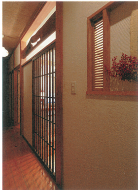
①光がこぼれ、格子・欄間・ガラリの影を廊下に映し出す