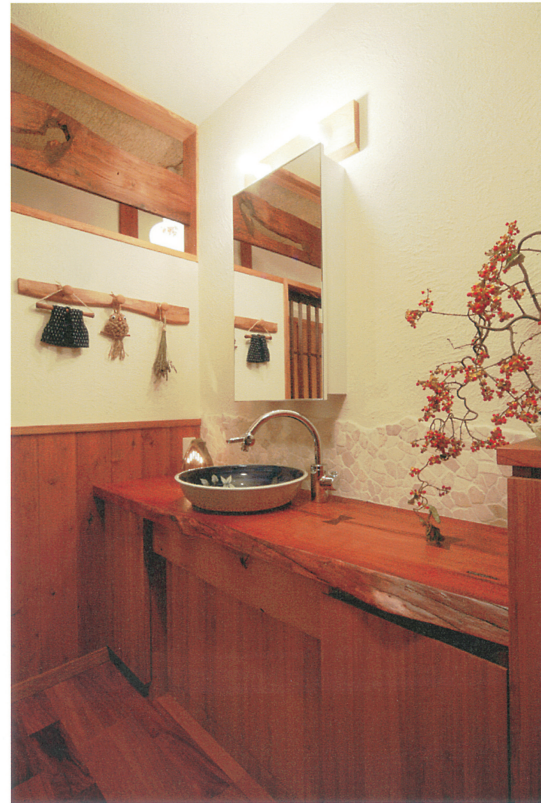
③カウンターのカルンや幕板のくぬぎなど集めた古材をいたる所に使用