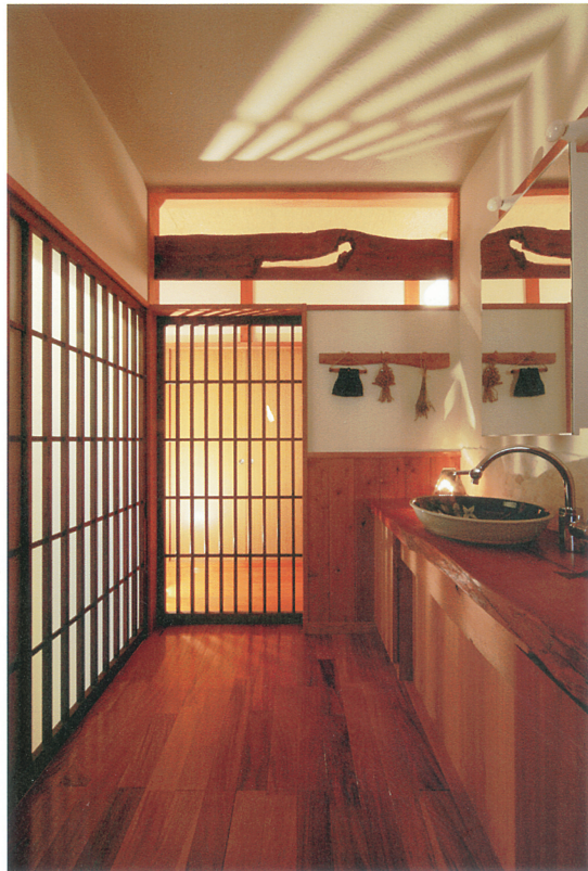
②アンティークの扉や古材が姿を変え、新たな役割を担う