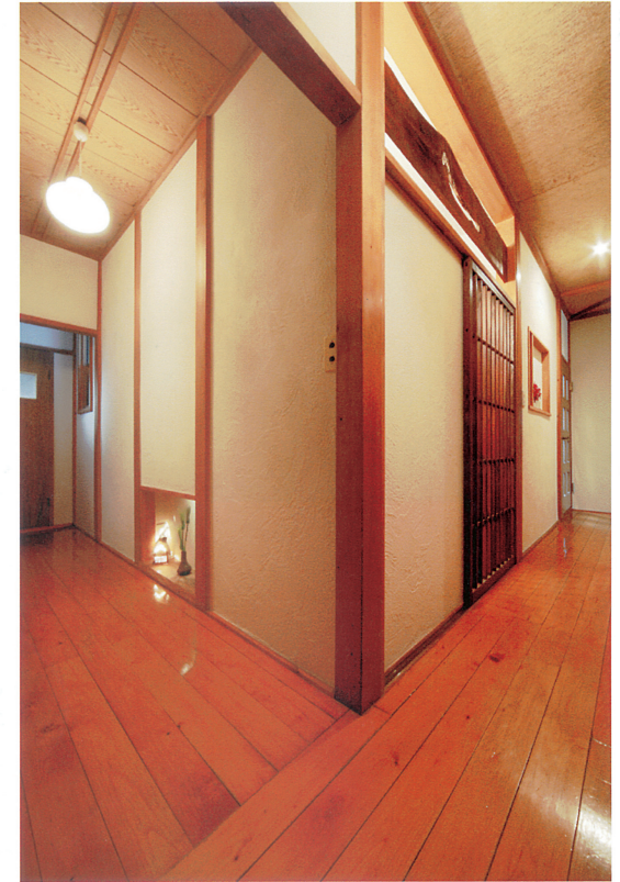
④壁面のニッチは狭い廊下にゆとりを感じさせてくれる