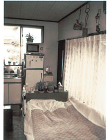
D: DKと寝室が1つの部屋に・・・