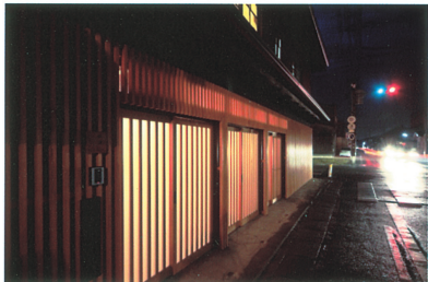
③旧美濃路沿いに木格子