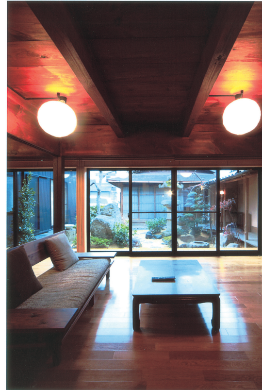
⑤分断されていた個室を居間にリフォーム