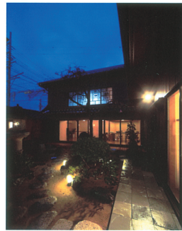
②よみがえった中庭と2階既存ガラス窓の調和