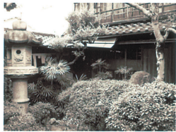
B: 鬱そうとした中庭