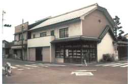
A: 北西外観。道路に面する店舗シャッター