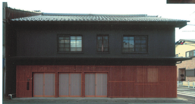
④北側外観。シャッターを撤去

リフォームの動機/設計・施工の工夫点/施主の感想・満足度/住宅の価値を向上させた内容など