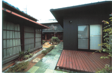
①既設の茶室と母屋がつくるアプローチ