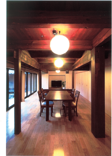
⑥既存の構造材を生かしたダイニング・居間