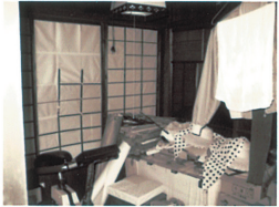
C: 南中庭に面する部屋が納戸に・・・