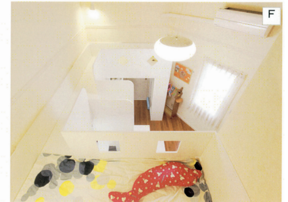
A・B: 中央の階段は収納も十分な造作家具。 C: 大きな段差も子どもたちには楽しい遊び場。 D: ロフトベッドの下が専用の机と収納。 E: 小屋裏収納用の階段を部屋の鋭角コーナーに設置。 F: 小屋裏収納からロフトベッドと部屋全体を見下ろす。

リフォームの動機/設計・施工の工夫点/施主の感想・満足度/住宅の価値を向上させた内容など