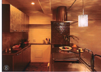
排水管を隠すため、飾り棚兼カウンターを設置した。