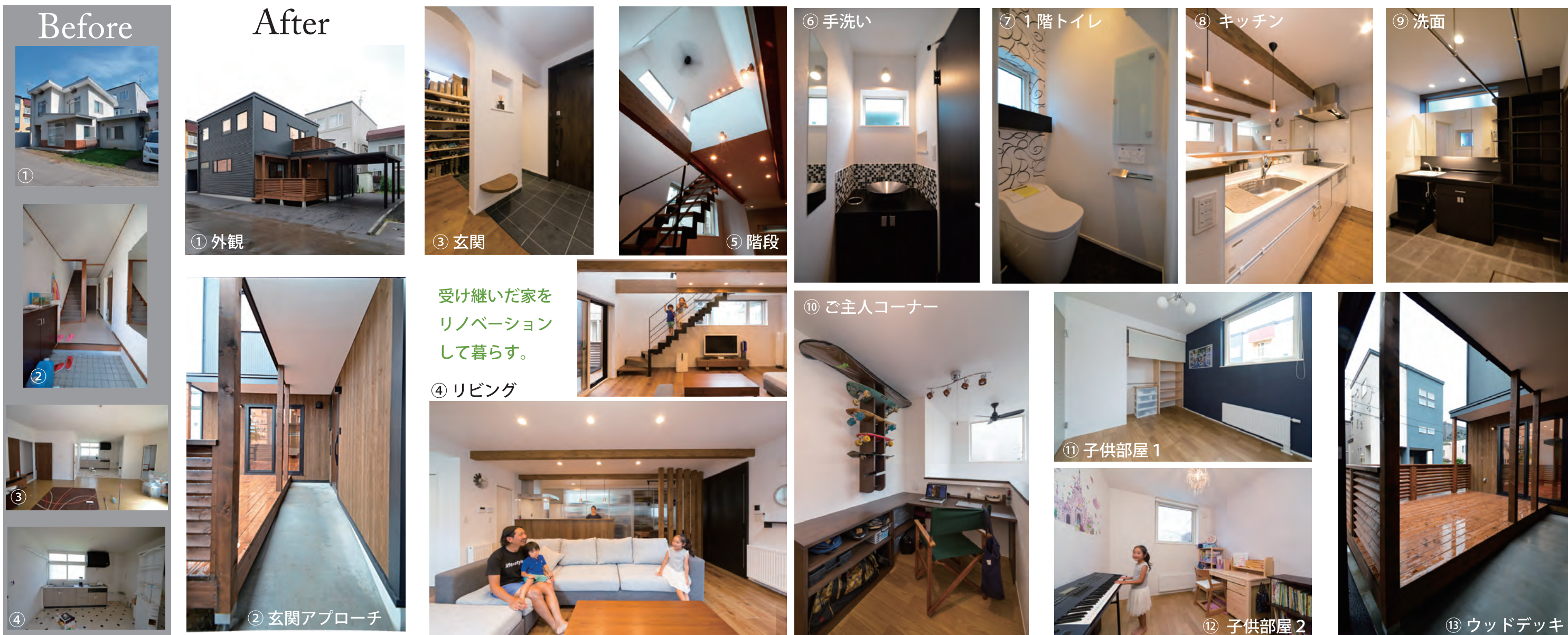
リフォーム前後の写真

築43年の住宅をスケルトン解体し、既存の構造を生かしながら断熱等級を上げ新耐震基準をクリアしている。デッキを内包するアプローチなど楽しさを満載しながら実家を受け継いだ「親孝行な」例である。道内産の素材を主体にまとめればなお良かっただろう。