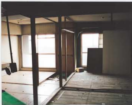
リフォーム前後の写真