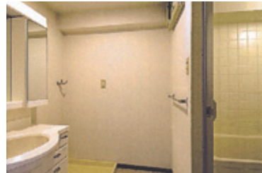
(B) 改築前の洗面所と浴室。