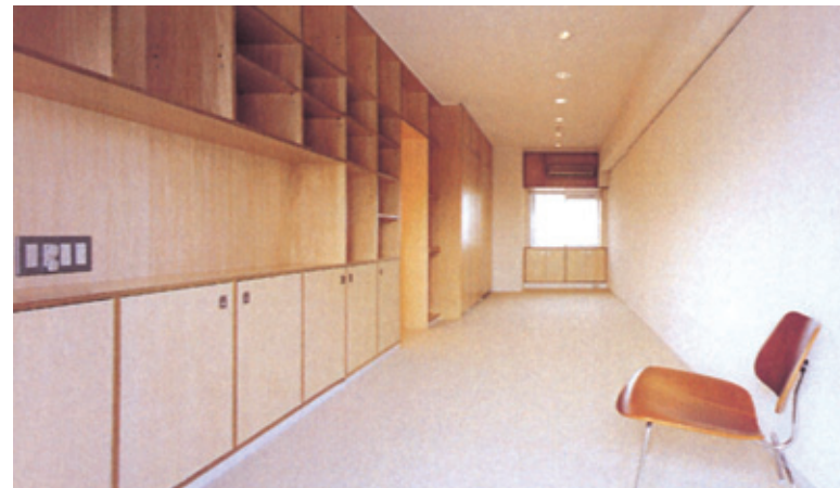
(F) プライベートなリビングでもあるギャリースペース、ダイニングとの構造壁一面には収納を設けている。