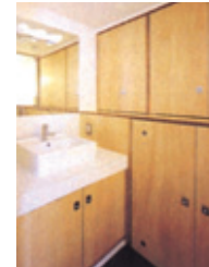
(E) 洗濯機、タオルや小物が入る大きな収納と開放的な浴室。