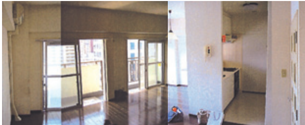
(A) 改築前のLDKスペース。