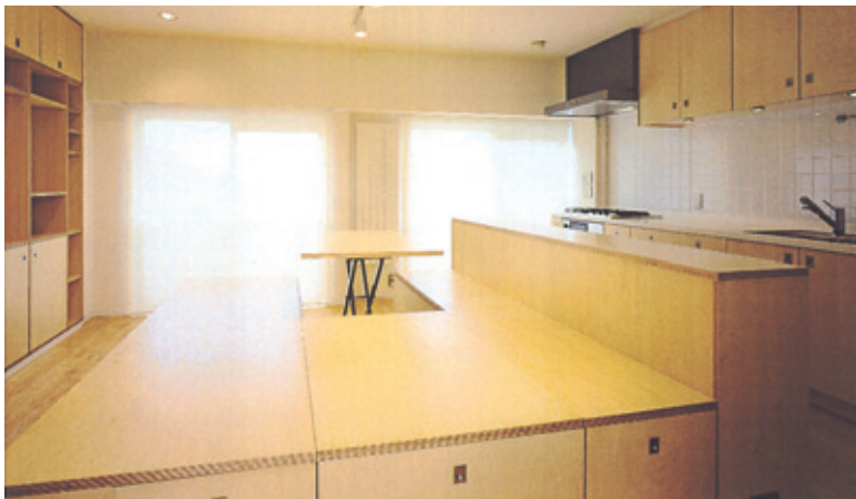
(C) ダイニングテーブルとソファが一体化した家具。ダイニングテーブルは一脚だけを上げた状態。

リフォームの動機/設計・施工の工夫点/施主の感想 など 《既存プラン》 くと狭くなってしまうため、ダイニングテーブル、ソファなどの用途を統合したステージフロアをLDKの中心に置く事で、広がりのあるスペースにした。 オイルスプリングで上げ下げが可能なダイニングテーブルは、通常長さ120cm。パーティー時にはさらに120cmのテーブルを継ぎ足すことで8人がけのテーブルになる。 ソファがわりに、ステージフロアに寝ころがってテレビを見ることもでき、またダイニングテーブルをしまえば、客用のベッドとして使用することも可能とした。 《提案》 既存LDKにキッチン、ダイニングテーブル、ソファを普通に置 特に配慮した住宅性能：躯体壁のためにプランをあまり変更できなくても、家具レベルの工夫で、空間を造り変えることを目指した。