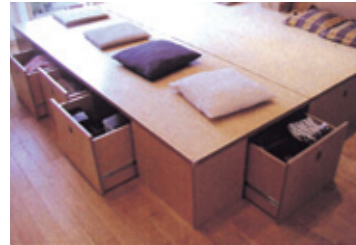
(D) ダイニングテーブルを下げた状態。テーブルが収まっているところ以外は収納。