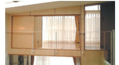
7. 子供部屋 南側全面窓を採用し、明るい開放的な雰囲気