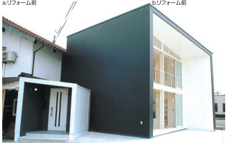
1. 外観 南へ筒状に向けた耐震壁を採用し、明るさと開放感を実現(新旧の融合を配慮した斬新なデザイン)