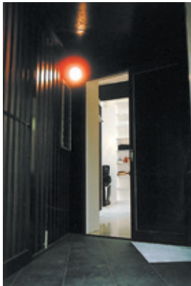
2. 玄関 思い出の鋼板外壁を残した