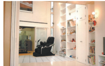
6. リビングとサンルーム 壁面いっぱいの大収納壁