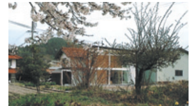
8. 街並み外観 斬新かつ街並みにもとけこむデザイン