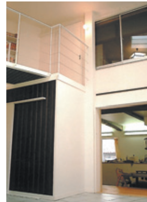
4. 接合部：リビングからダイニング方向 思い出の鋼板外壁・漆喰壁・窓を残した