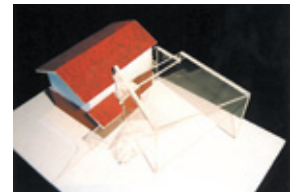
コンセプト模型(見下ろし)