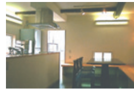
3.ダイニングキッチン リフォーム前は車庫スペース サンルームとの段差を利用したベンチ