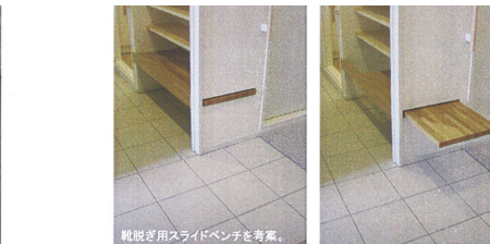
靴脱ぎ用スライドベンチを考案。