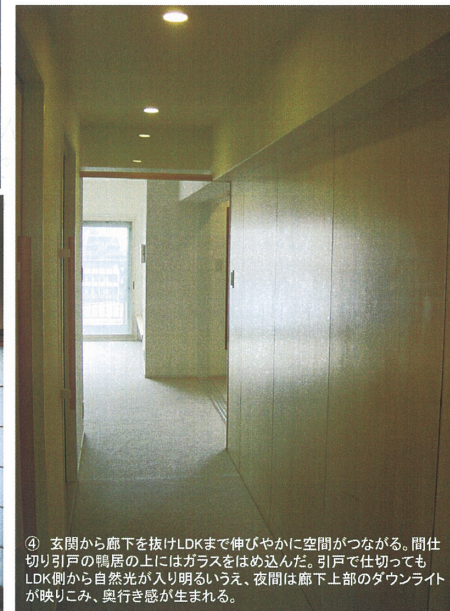
④ 玄関から廊下を抜けLDKまで伸びやかに空間につながる。間仕切り引戸の欄間の上にはガラスをはめ込んだ。引戸で仕切ってもLDK側から自然光が入り明るいうえ、夜間は廊下上部のダウンライトが映りこみ、奥行き感が生まれる。