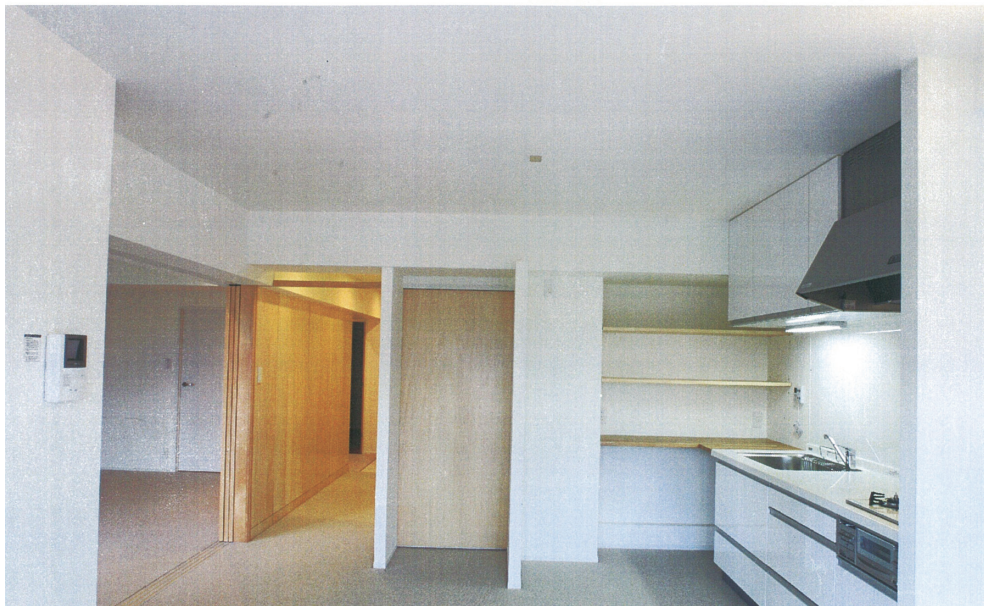
① LDK 寝室、廊下がつながった状態。シナベニヤの引戸で仕切ることができる。正面のニッチには既存食器棚を収納、その右の白壁部分はPS(手前は冷蔵庫置き場)で梁に囲まれたデッドスペースにキッチン準備スペースを設けた。下部は米びつ、ゴミ箱収納、中段はレンジ、準備作業場、上段はかこによる食品ストック。