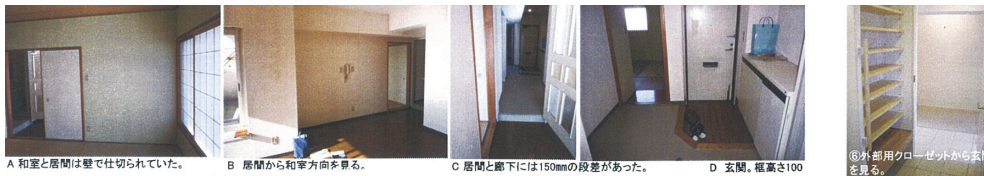
A 和室と居間は壁で仕切られていた。 B 居間から和室方向を見る。 C 居間と廊下には150mmの段差があった。 D 玄関、扉高さ100