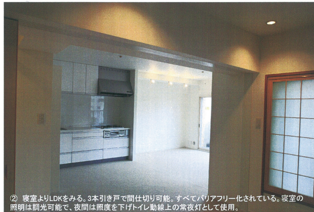
② 寝室よりLDKをみる。3本引き戸で間仕切り可能。すべてバリアフリー化されている。寝室の照明は調光可能で、夜間は照度を下げトイレ動線上の常夜灯として使用。